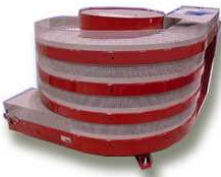
SPIRAVEYOR Tours de séchage