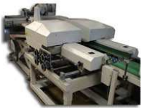
IN LOG Finition Post Press