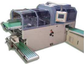
EASYLINE Matériel de Reliure