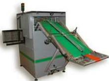
METRIS Convoyeurs Stackers