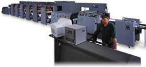
DIDDE Rotatives offset

ZA du Hameau de Villiers F-77133 MACHAULT Tel : 01 64 23 69 88 Fax : 01 60 74 23 22 www.smg-systems.fr