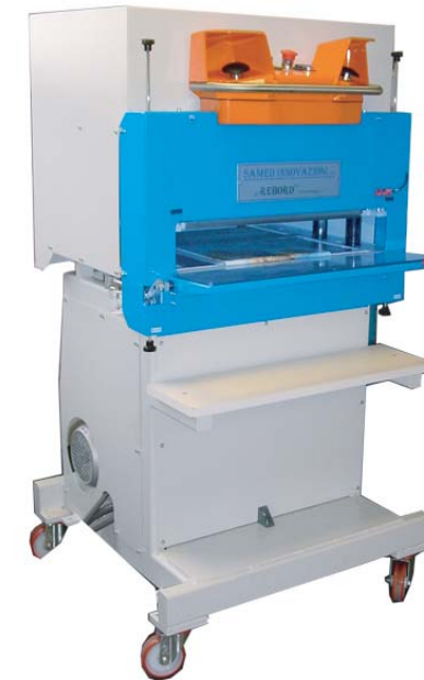
Repinçage à chaud